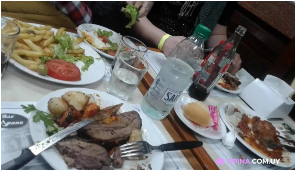
Bar hispano milanesa