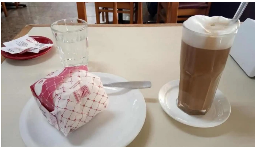
Bar hispano cafe