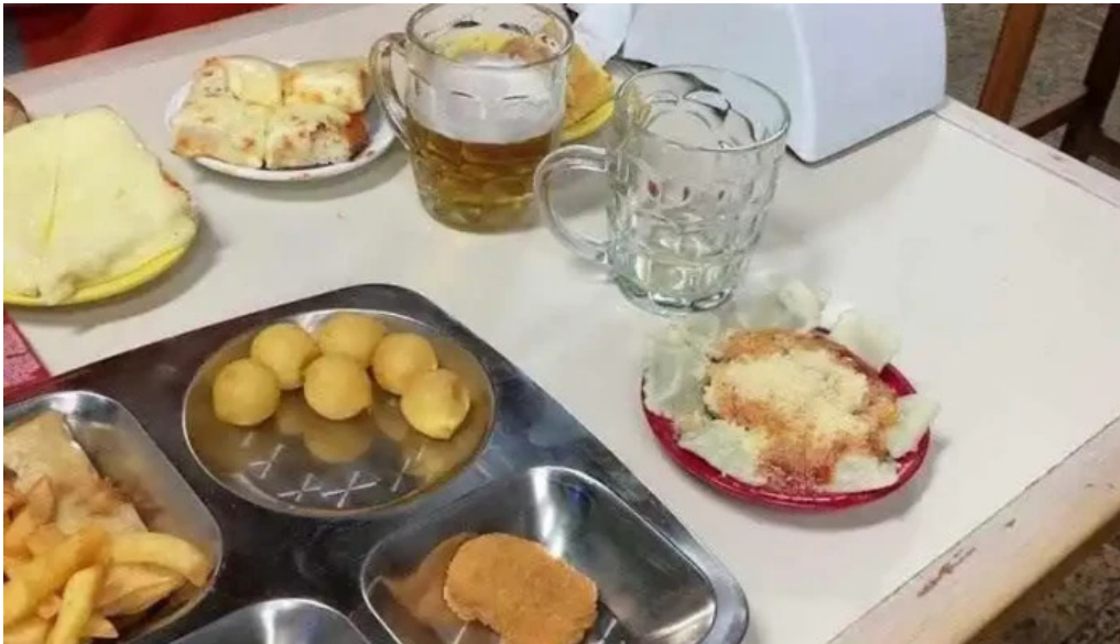
Bar hispano videos