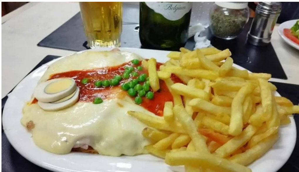
Bar hispano mas recientes