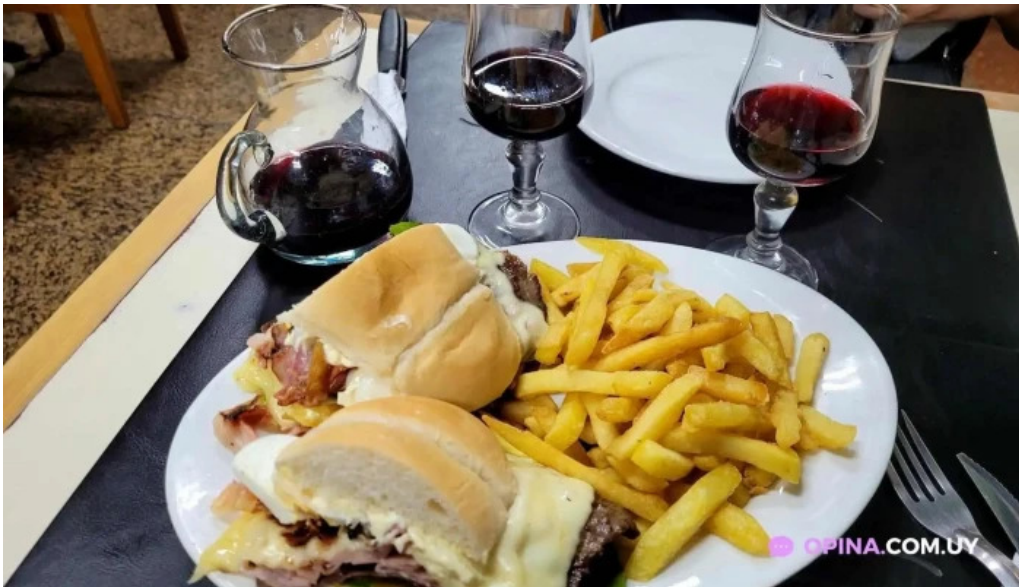
Bar hispano papas fritas