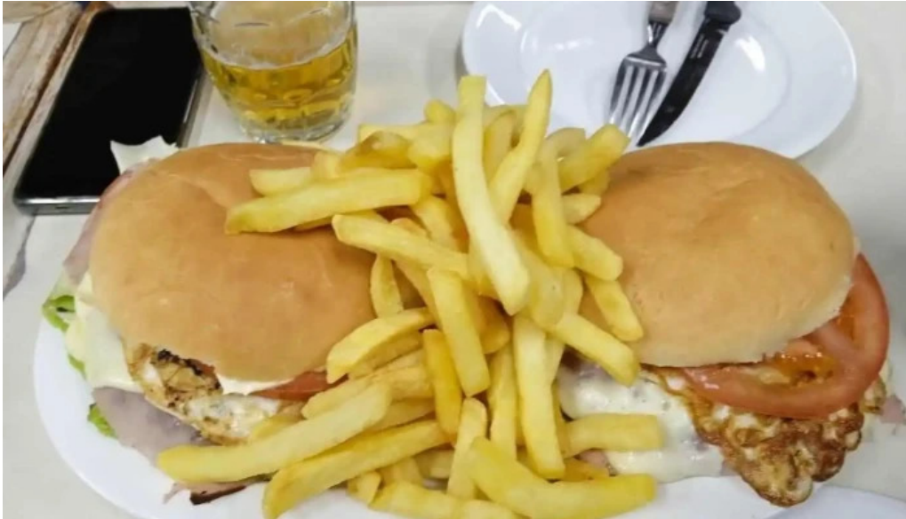
Bar hispano sandwich de pollo