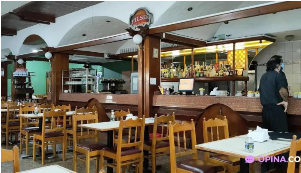
Bar hispano montevideo