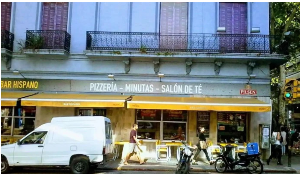
Bar hispano todas