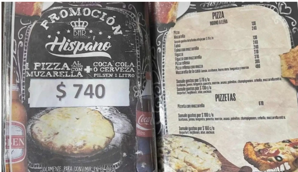
Bar hispano menu