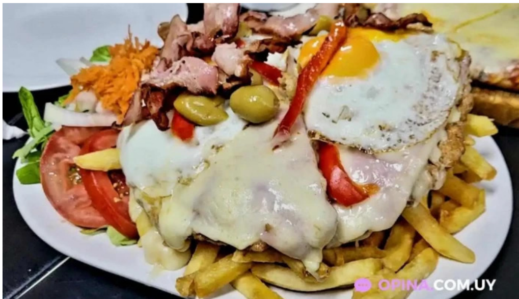
Bar hispano comida y bebida