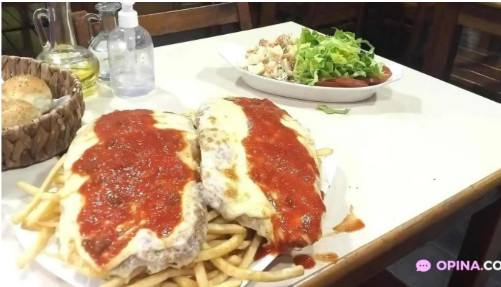
Bar dos avenidas papas fritas