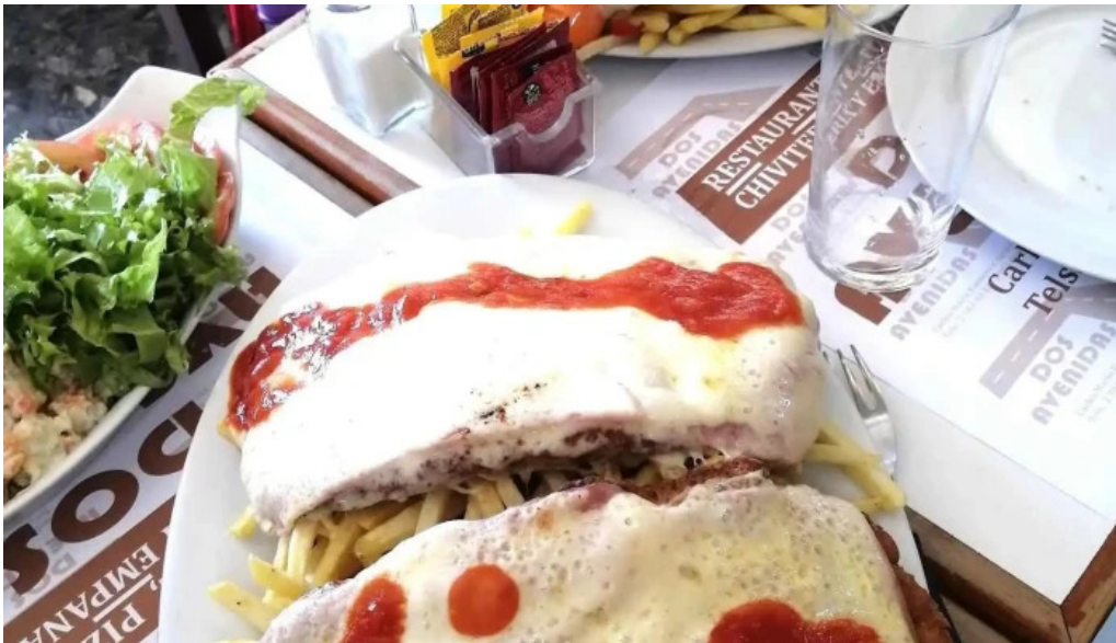
Bar dos avenidas milanesa