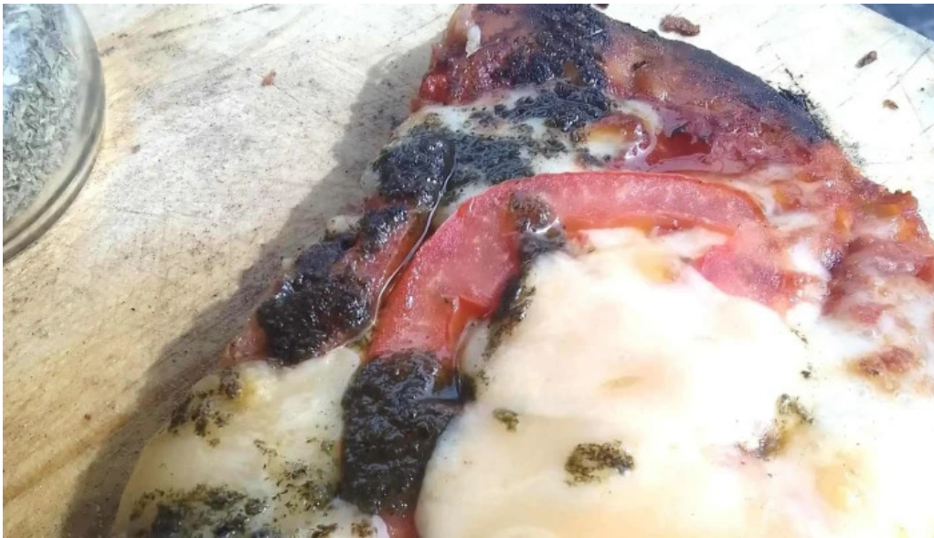
Bar dos avenidas comentario 2