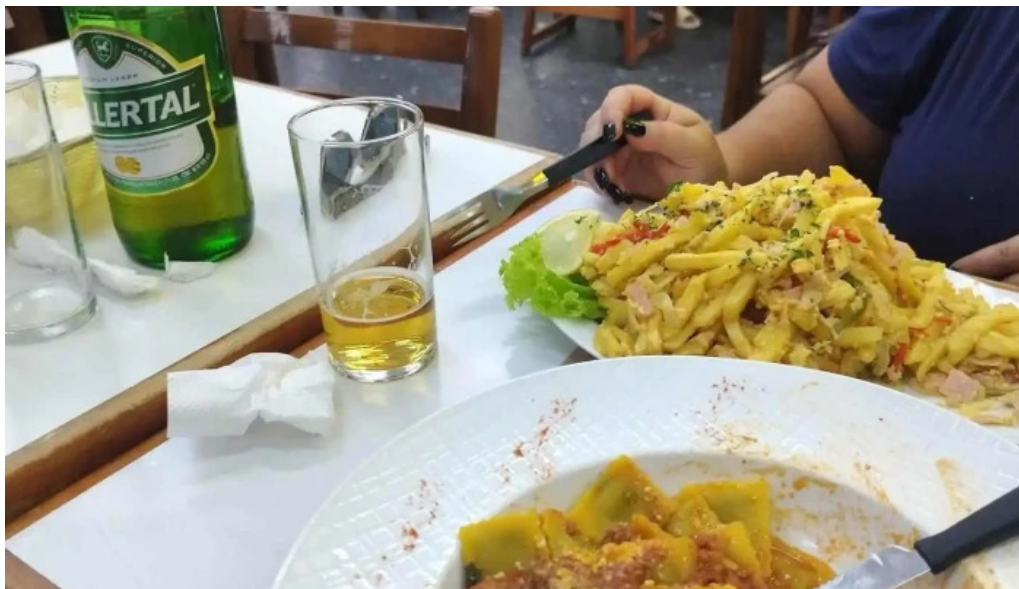
Bar dos avenidas comidas y bebidas