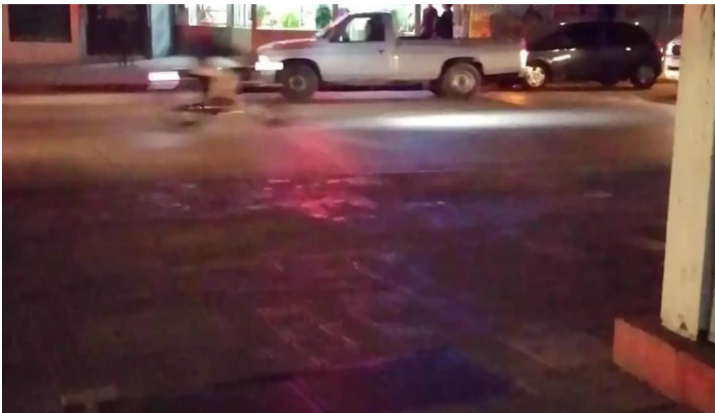
Bar dos avenidas videos