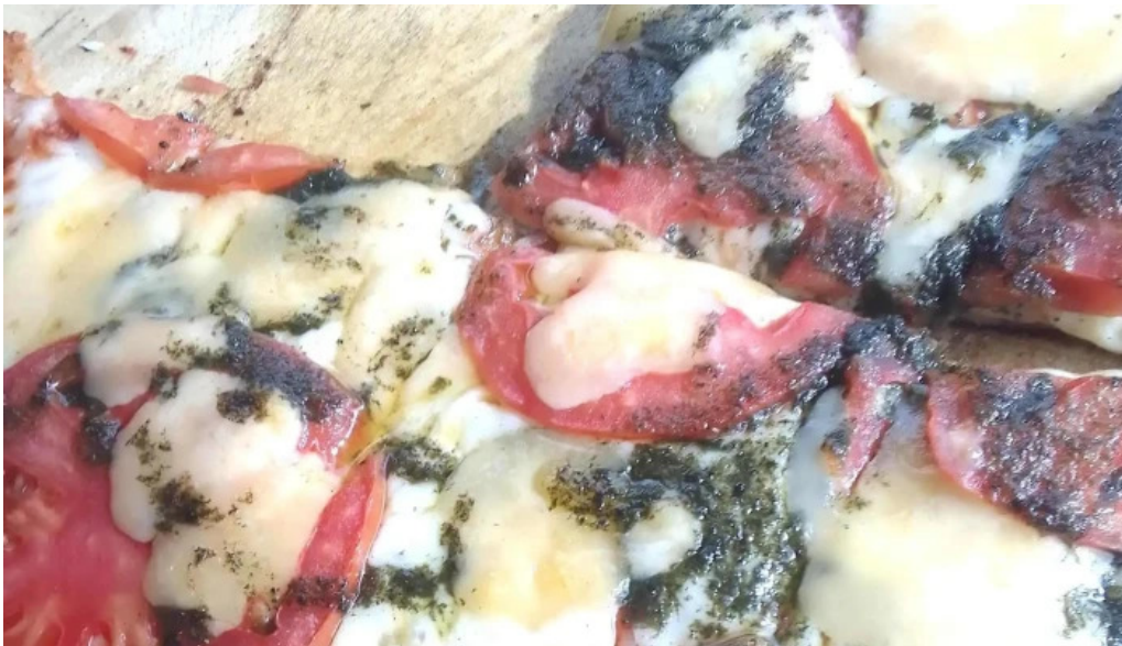
Bar dos avenidas comentario 4