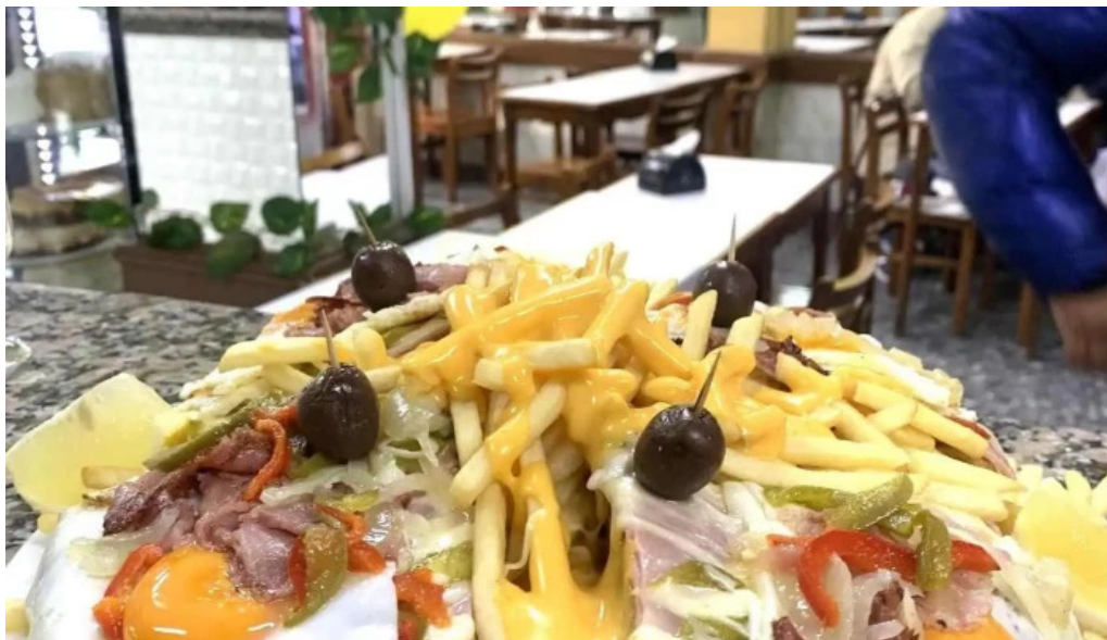
Bar dos avenidas recientes