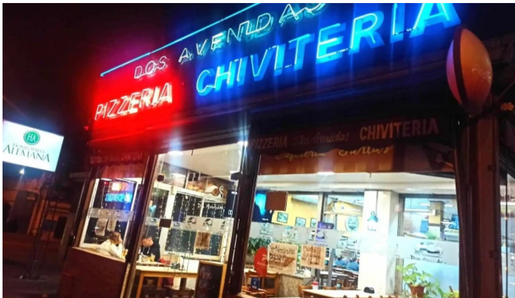
Bar dos avenidas todo