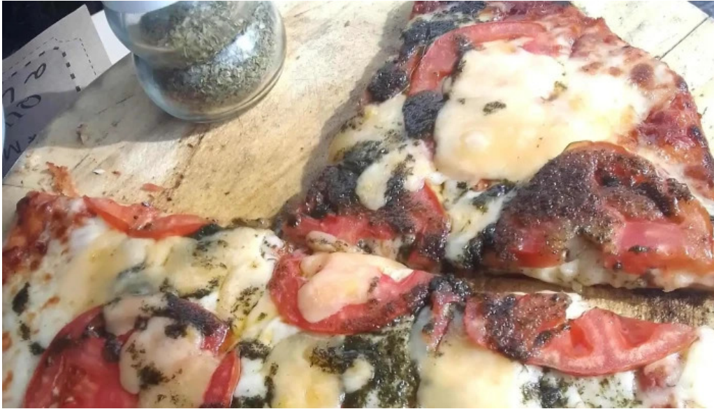
Bar dos avenidas comentario 3