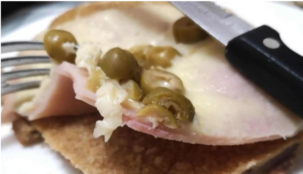
Bar dos avenidas comentario 5