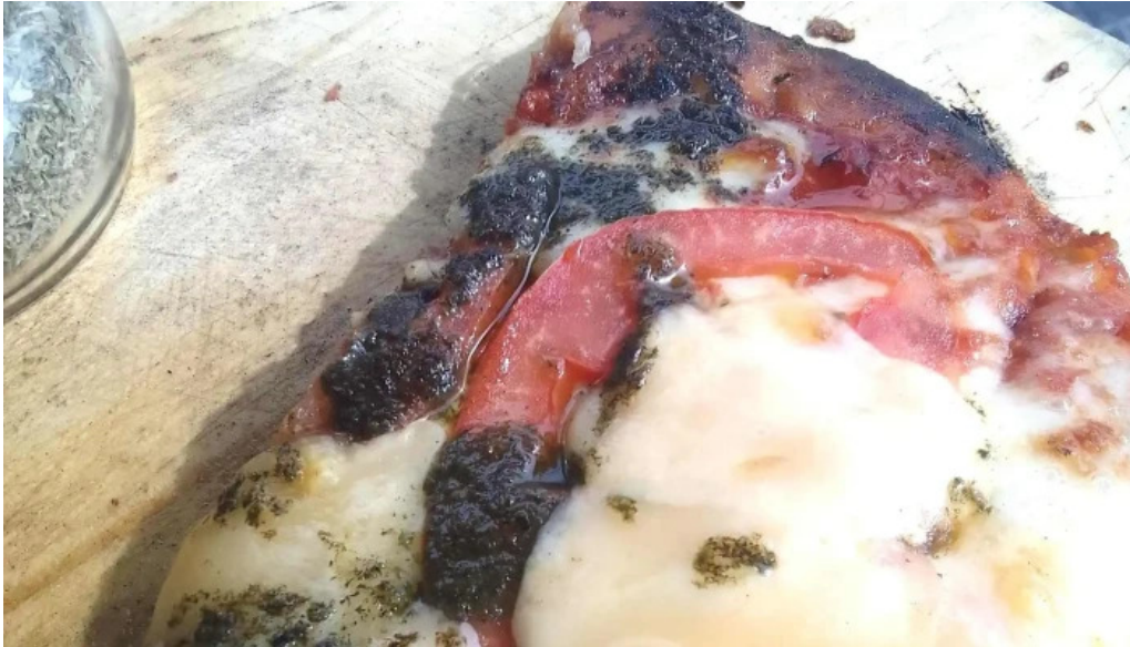
Bar dos avenidas comentario 1