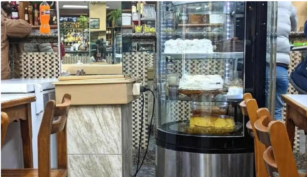
Bar dos avenidas ambiente