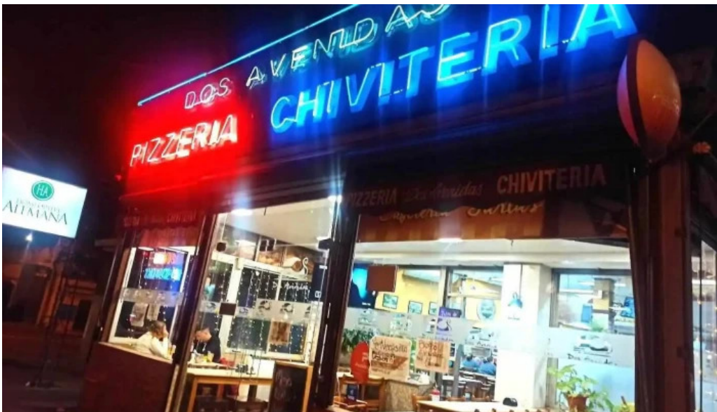
Bar dos avenidas montevideo