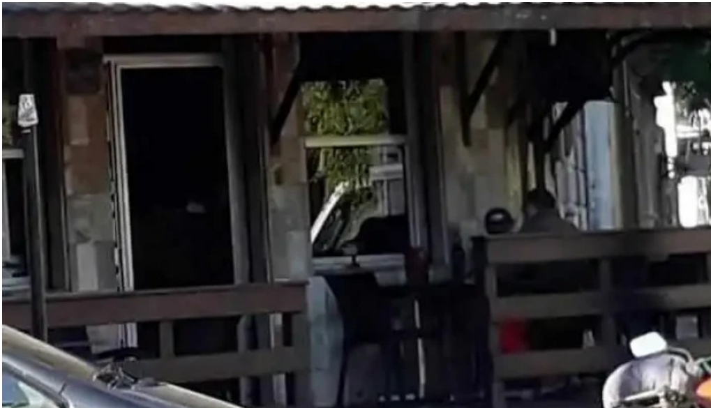
Jueves 5 videos