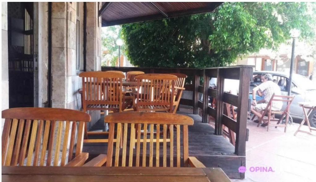
Jueves 5 montevideo