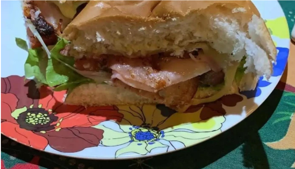
Jueves 5 comida y bebida