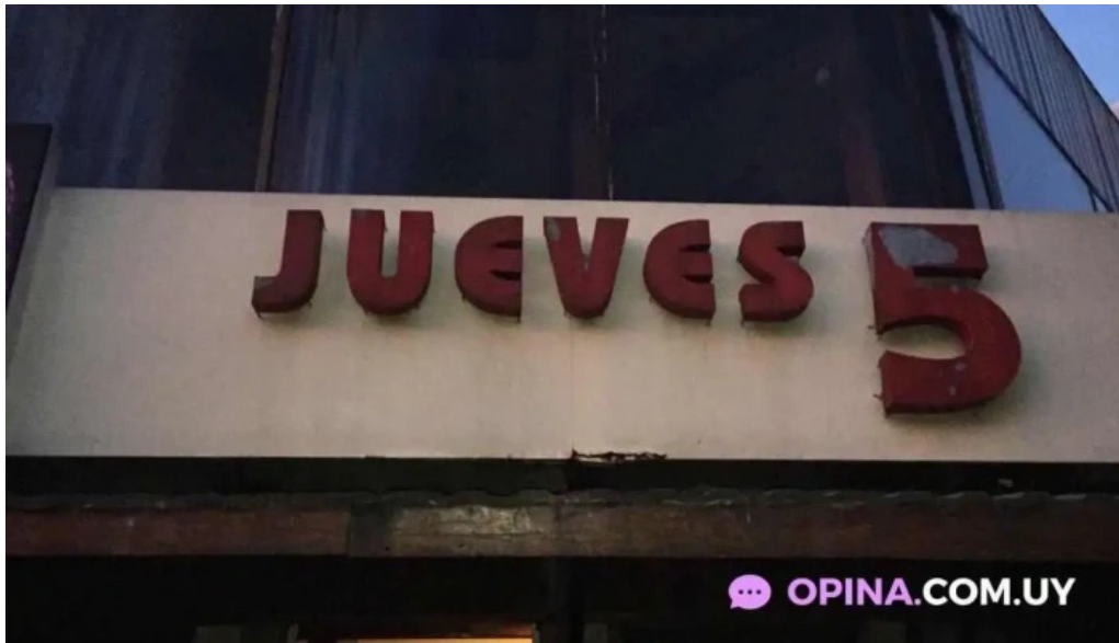
Jueves 5 del propietario