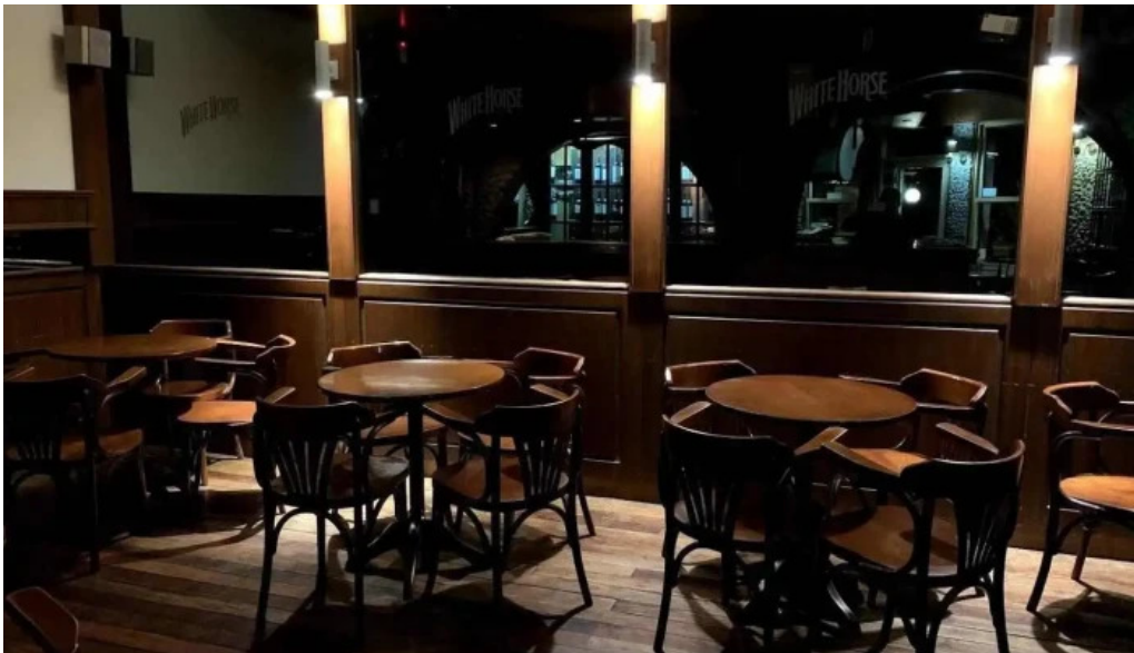
Jueves 5 ambiente