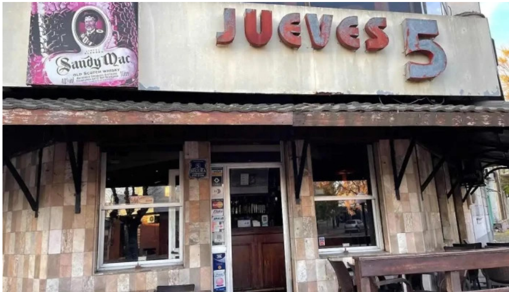
Jueves 5 todas