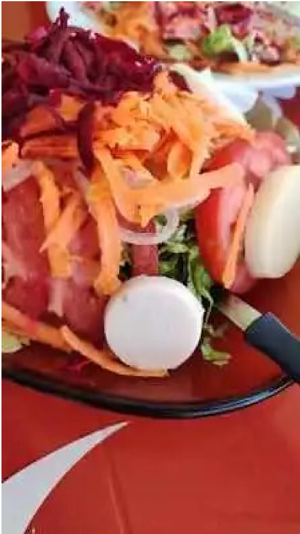
El chivito veloz mas recientes