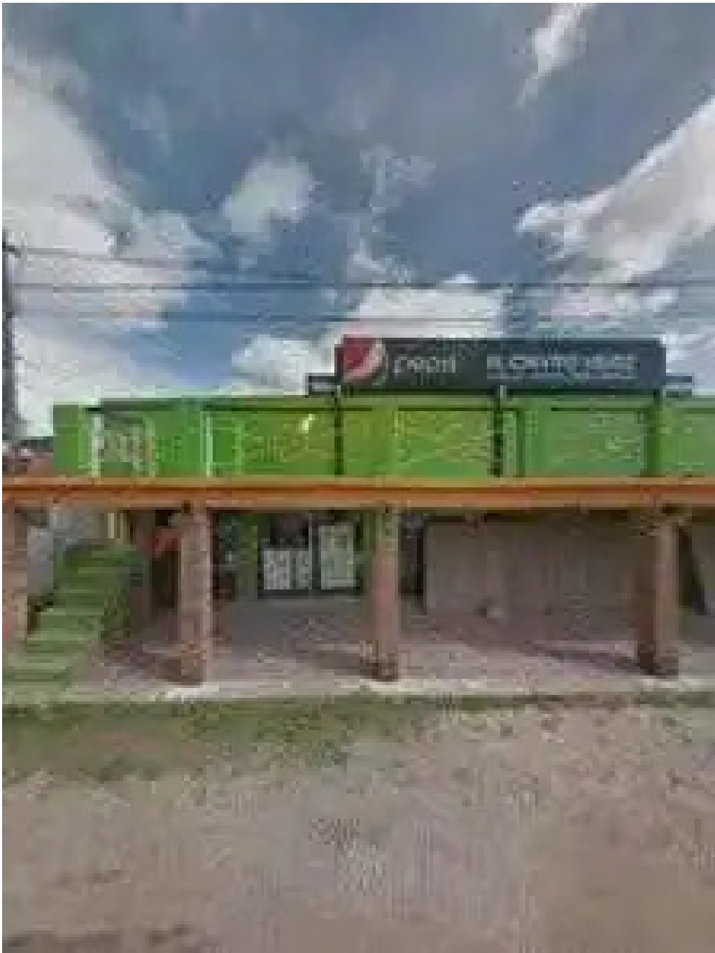
El chivito veloz street view y 360