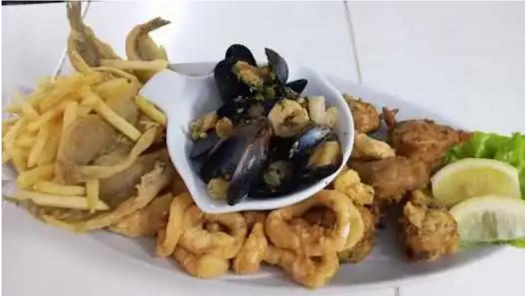
El chivito veloz papas fritas