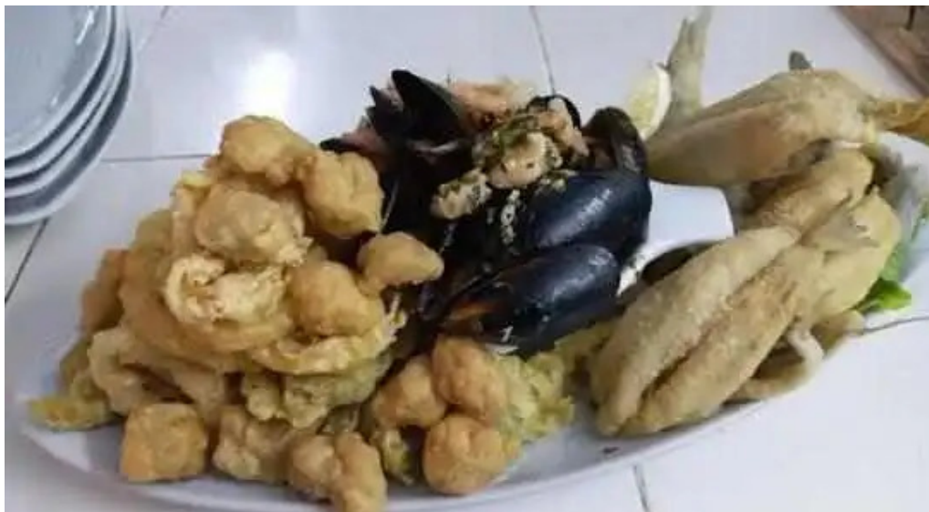
El chivito veloz del propietario