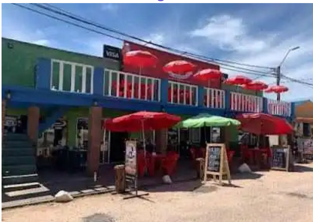
El chivito veloz