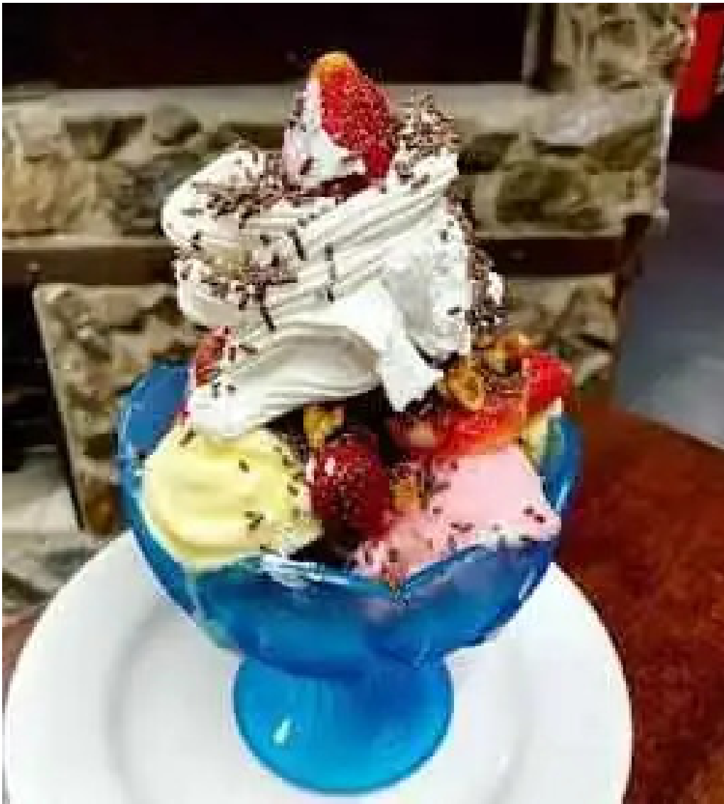
El chivito veloz comida y bebida