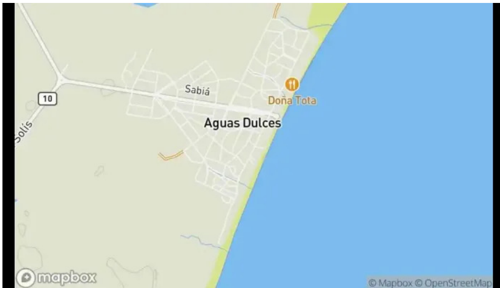
El chivito veloz mapa