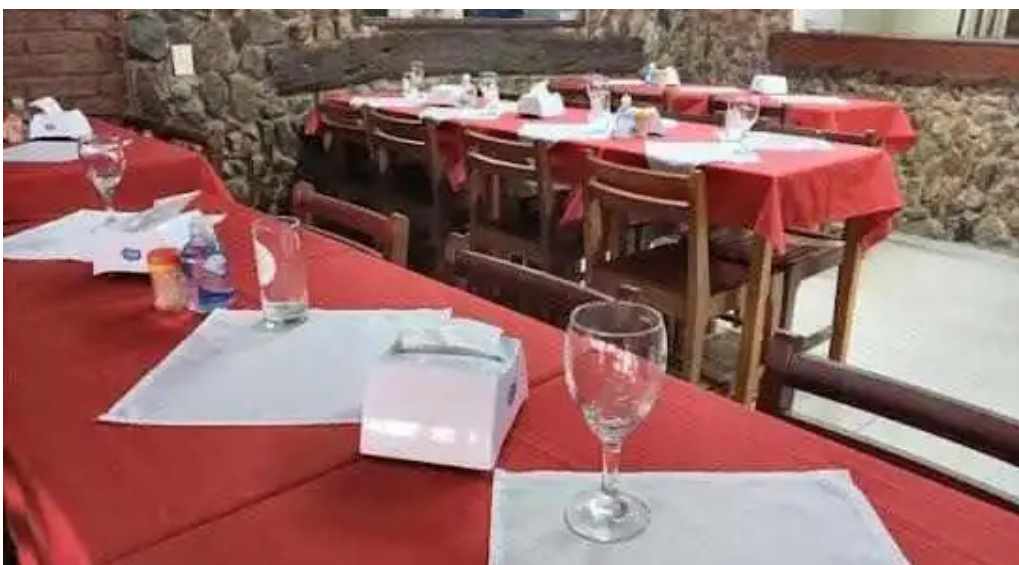
El chivito veloz ambiente