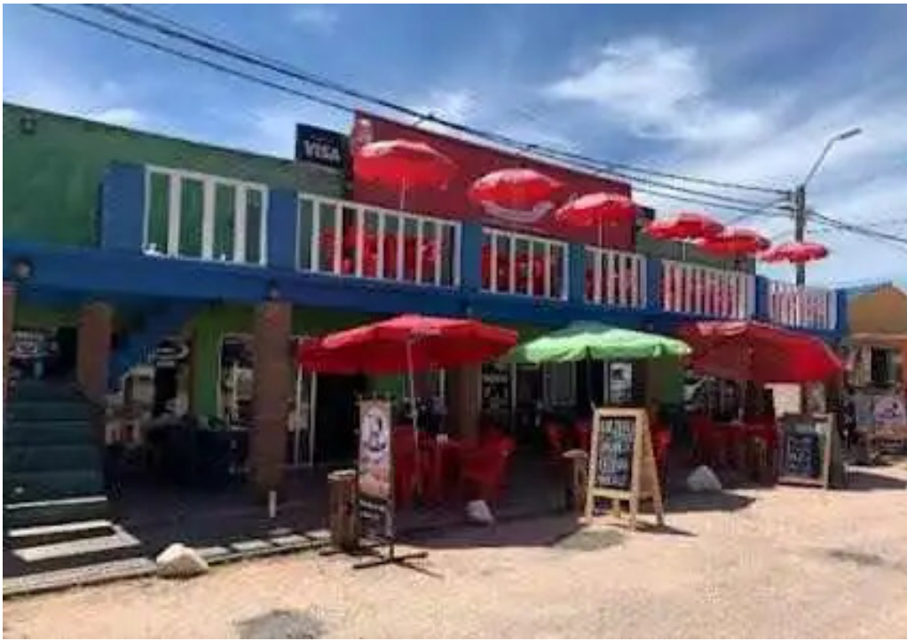
El chivito veloz todas