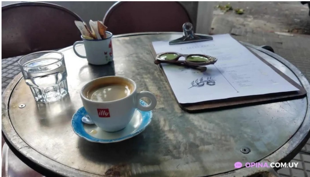
Candy bar cafe