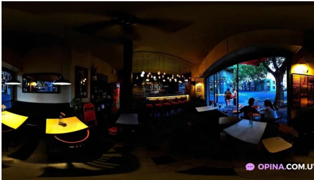
Candy bar street view y 360