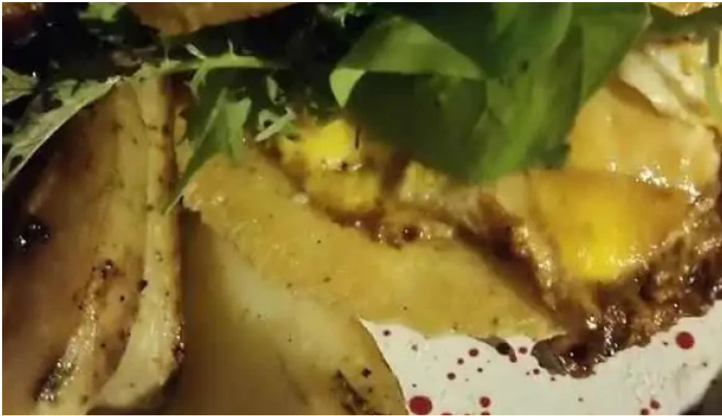
Candy bar mas recientes