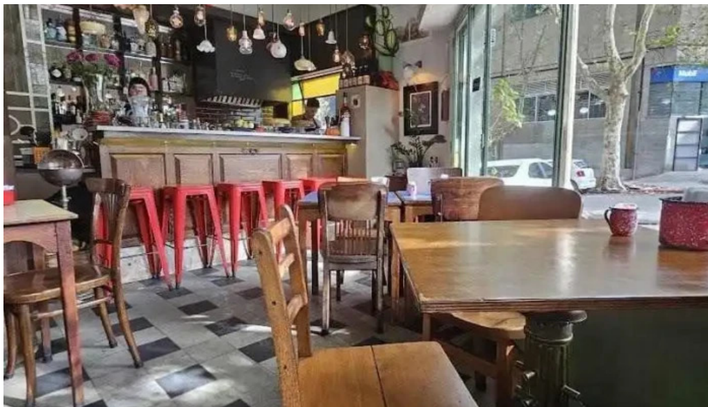
Candy bar ambiente