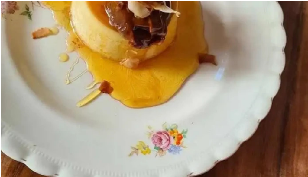
Candy bar flan