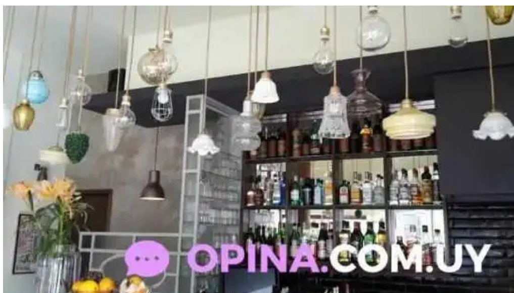
Candy bar todas