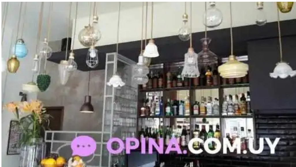
Candy bar montevideo