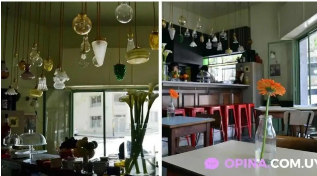
Candy bar del propietario