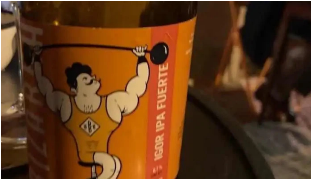
Candy bar cerveza