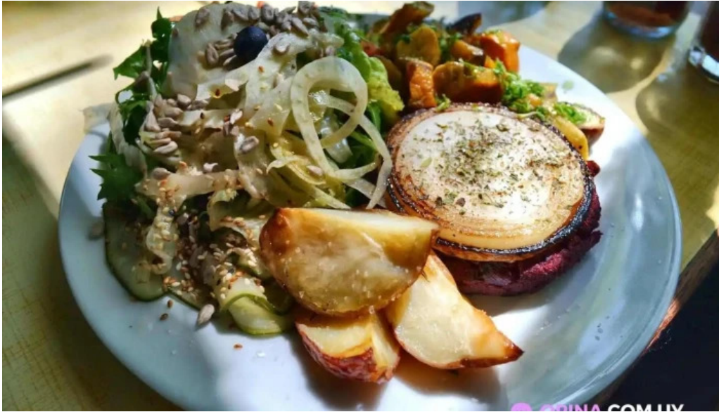
Candy bar comida y bebida