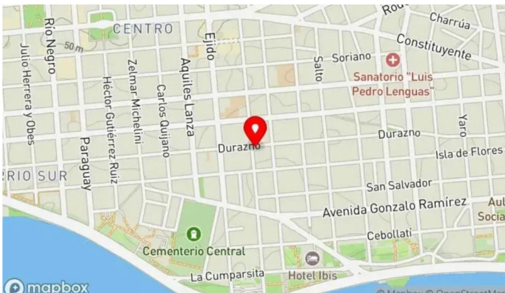
Candy bar mapa