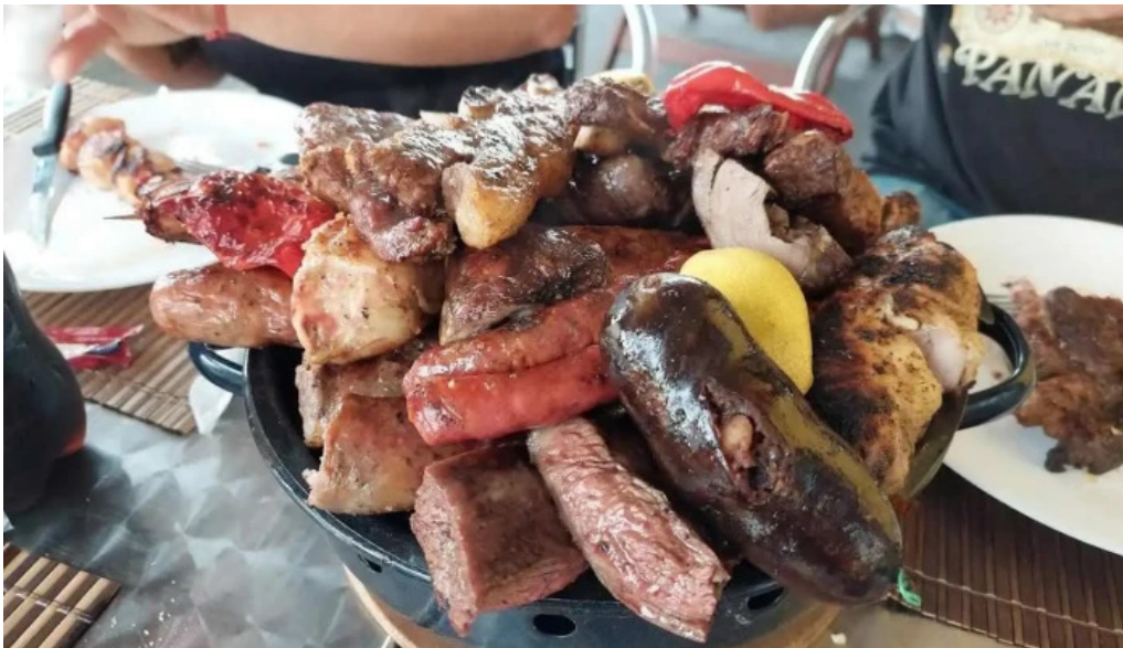
Al paso parrilla comida y bebida