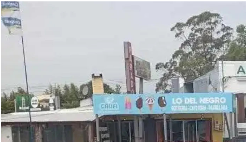
Al paso parrilla mariscala