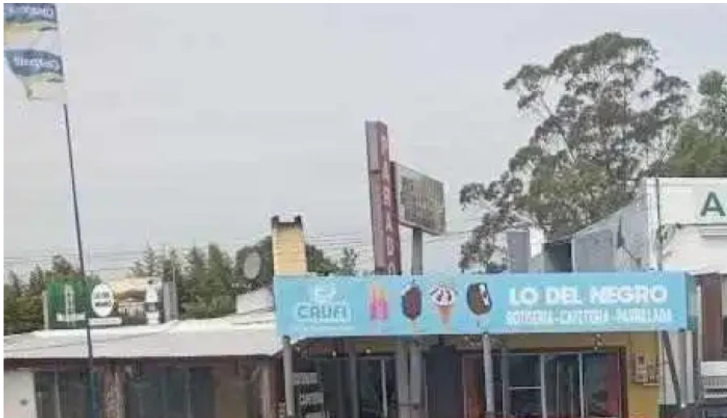
Al paso parrilla mas recientes