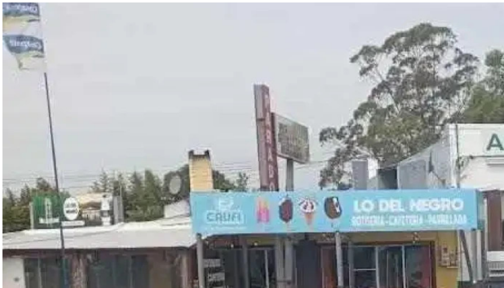
Al paso parrilla todas