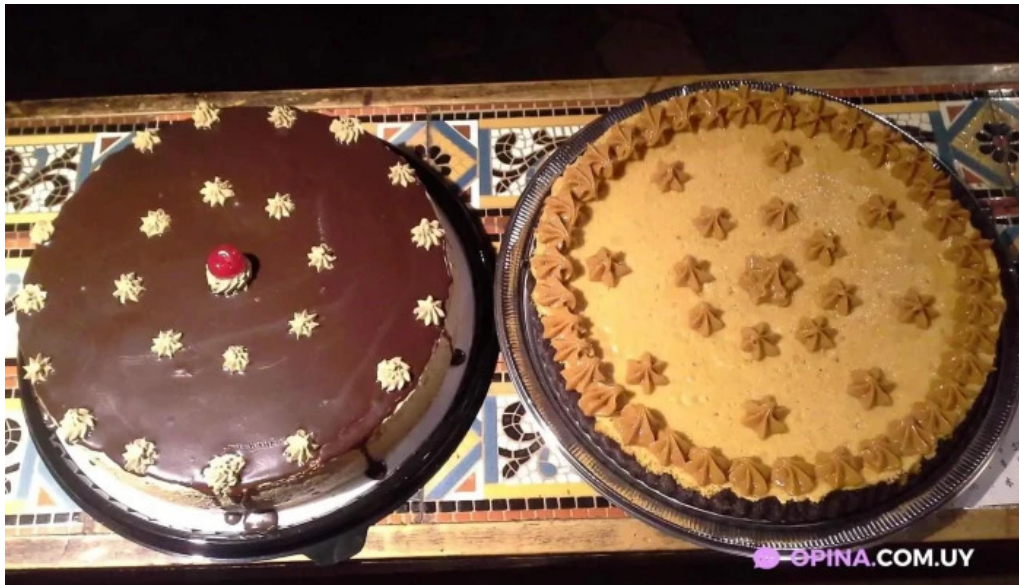
Buen suspiro del propietario