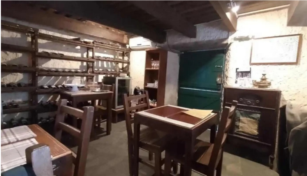
Buen suspiro ambiente