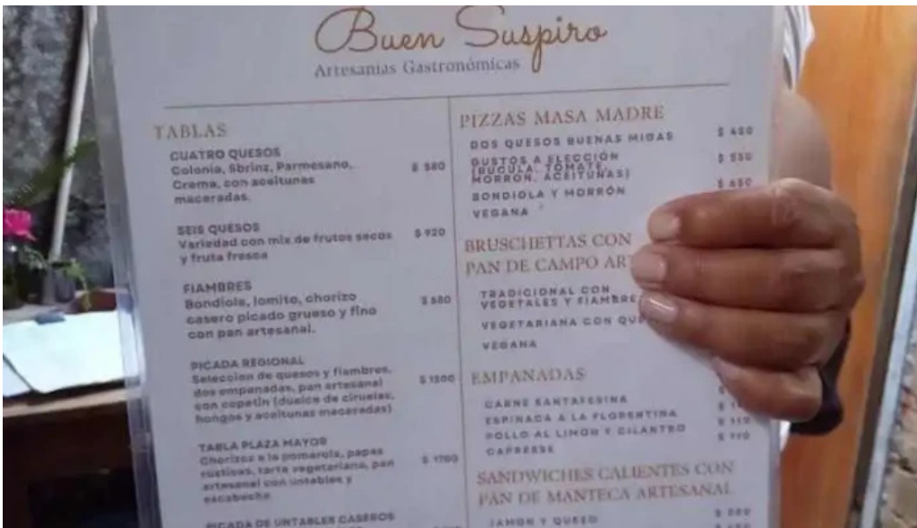
Buen suspiro menu