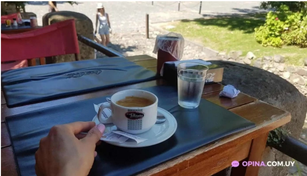
Buen suspiro cafe