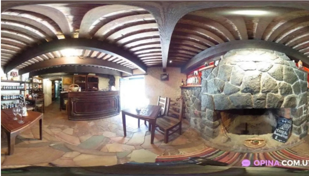
Buen suspiro street view y 360