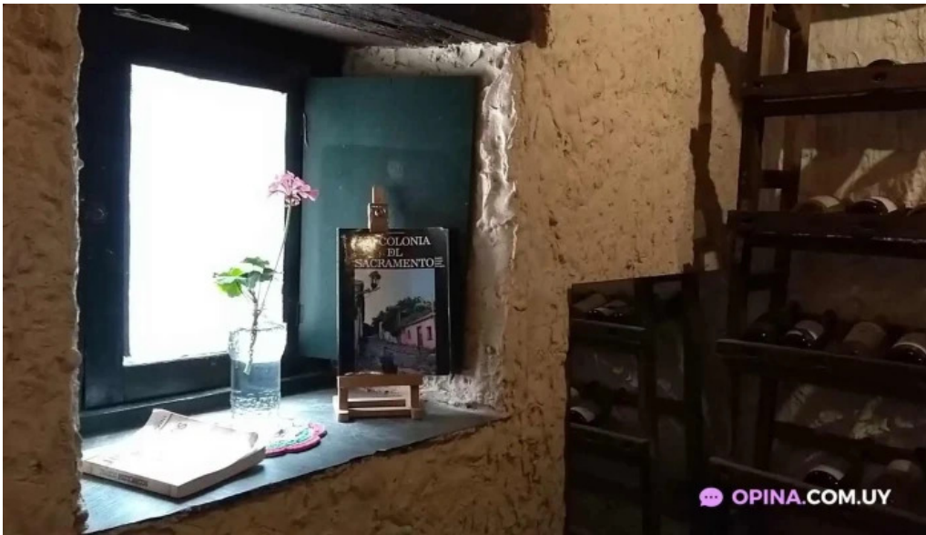
Buen suspiro videos