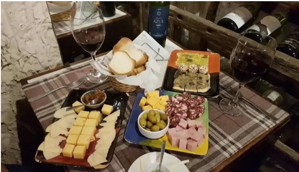
Buen suspiro picada