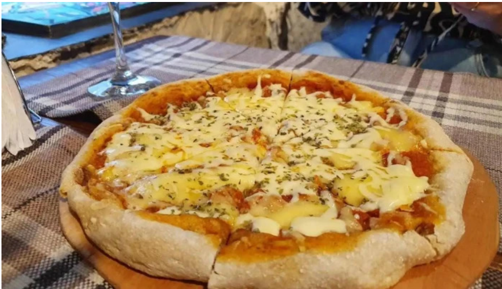
Buen suspiro pizza