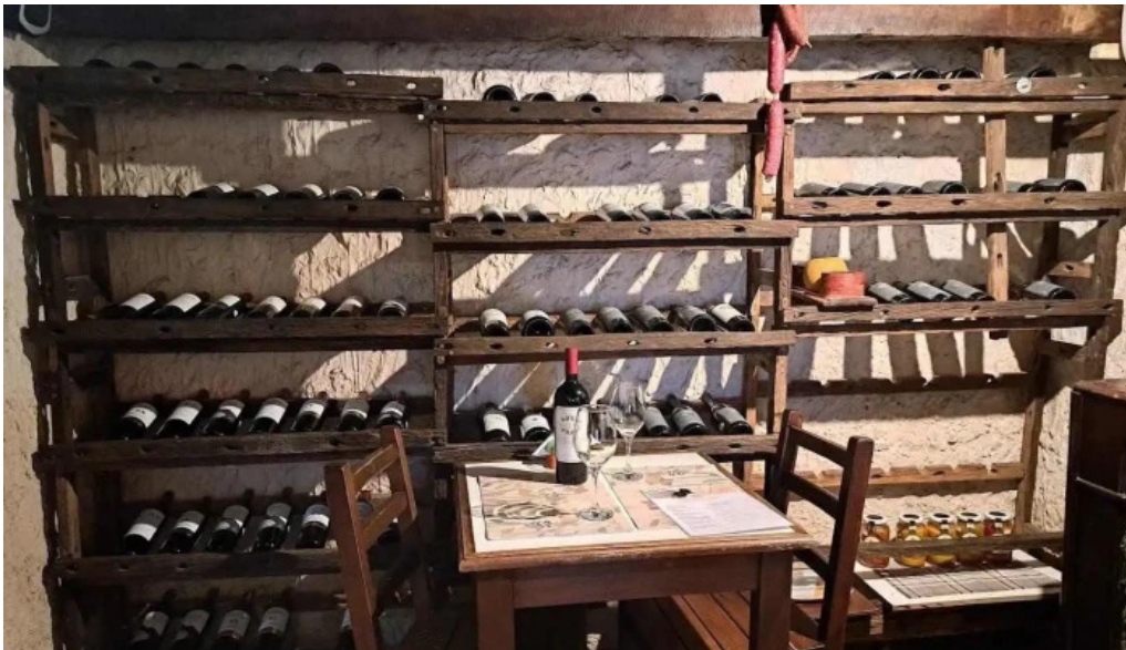
Buen suspiro todas