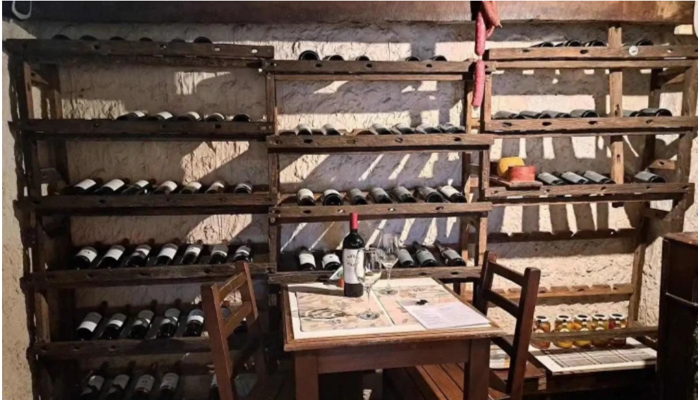
Buen suspiro col del sacramento