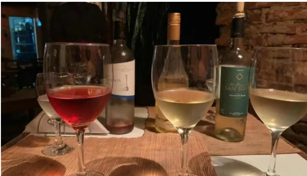
Buen suspiro vino