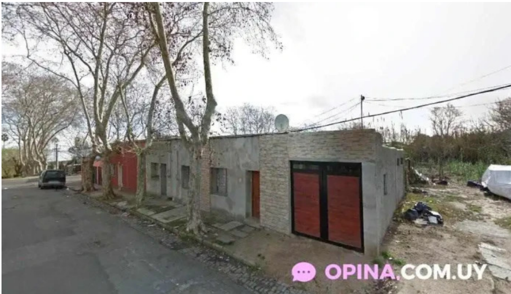
Unico pueblo de montevideo santiago vazquez