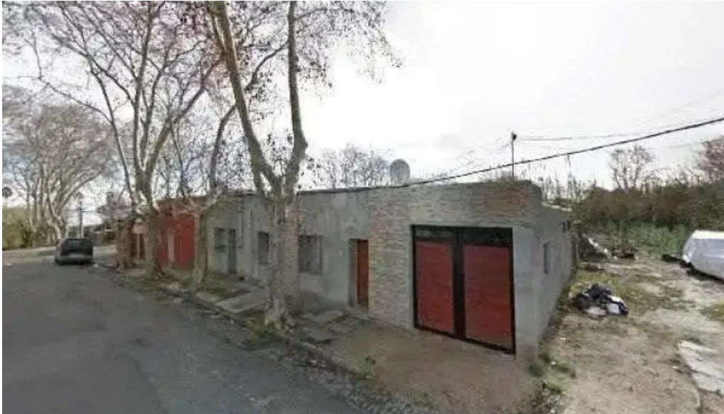
Unico pueblo de montevideo todo