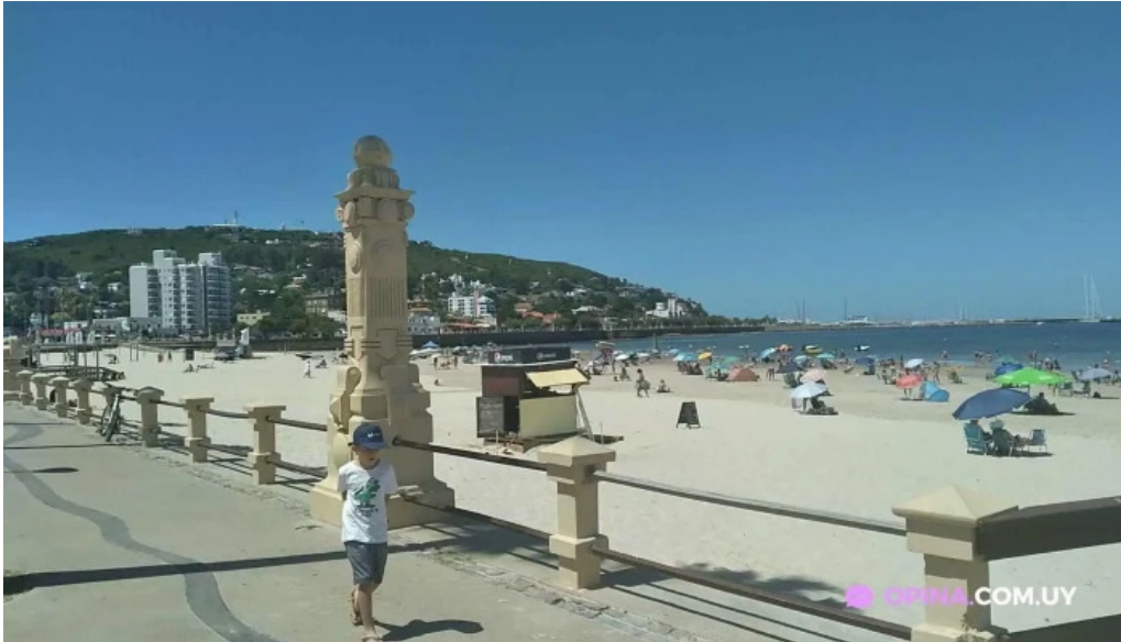
Rambla piriapolis videos