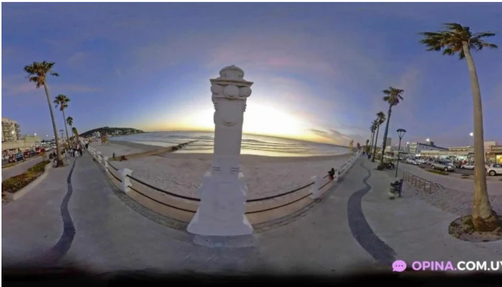
Rambla piriapolis street view y 360