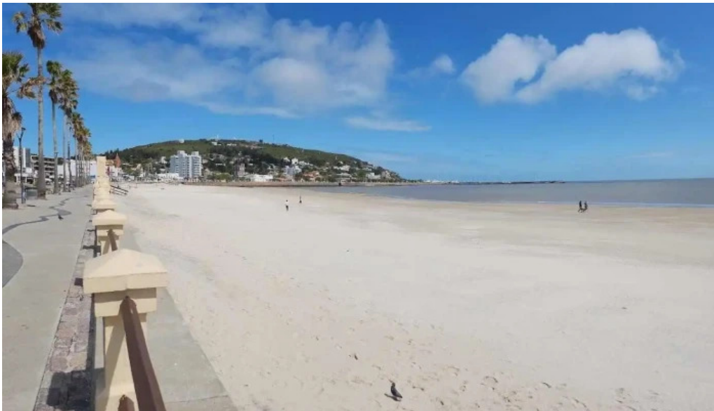
Rambla piriapolis todas