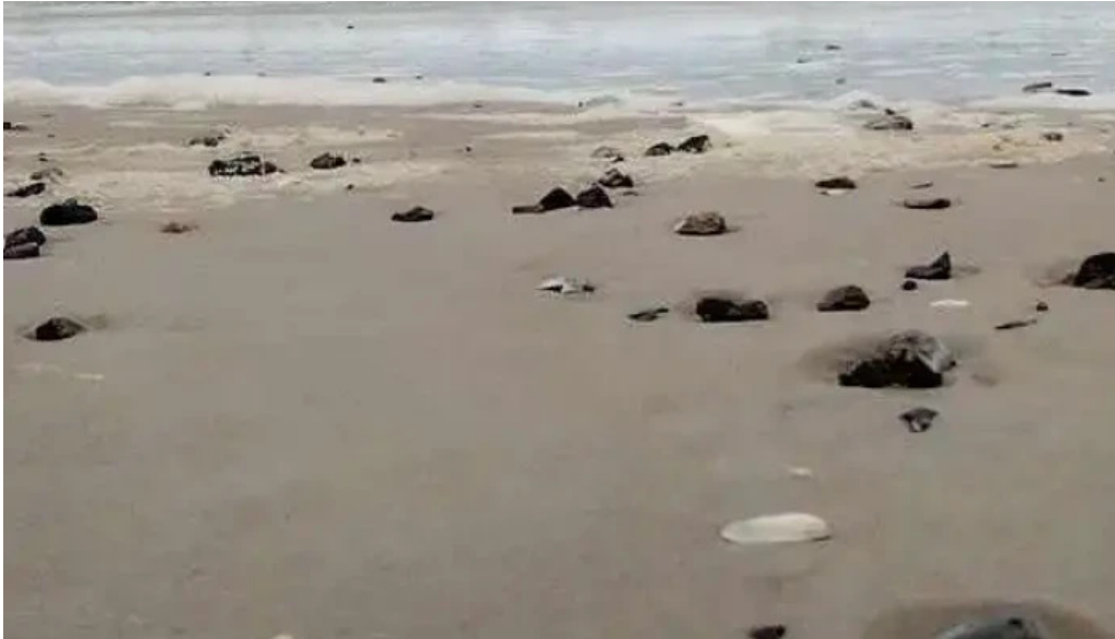
Rambla piriapolis mas recientes