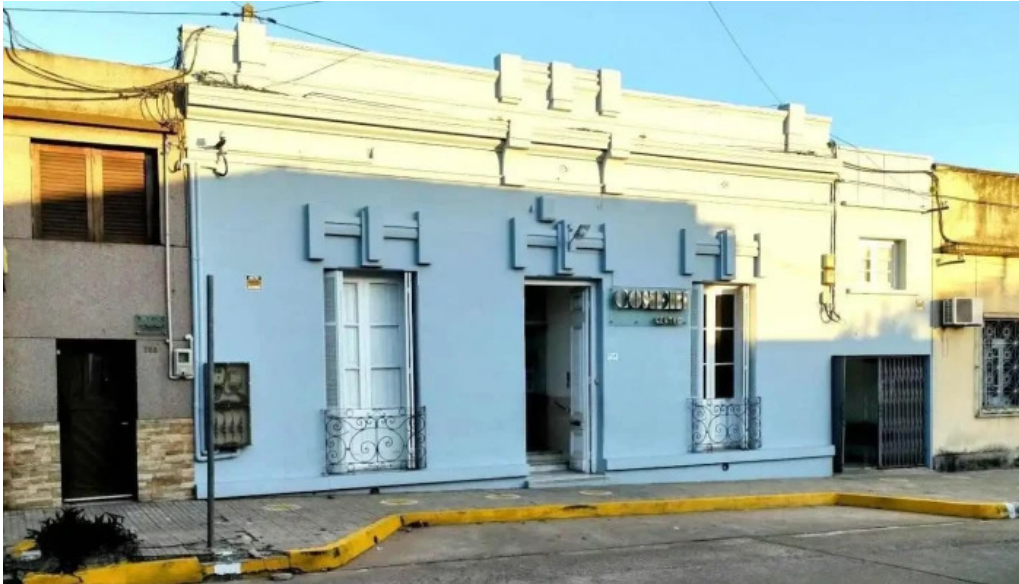
Sanatorio comeri clinica centro rivera