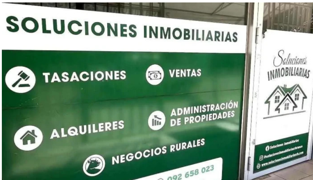
Soluciones inmobiliarias rb como llegar