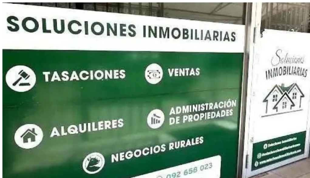
Soluciones inmobiliarias rb rio branco