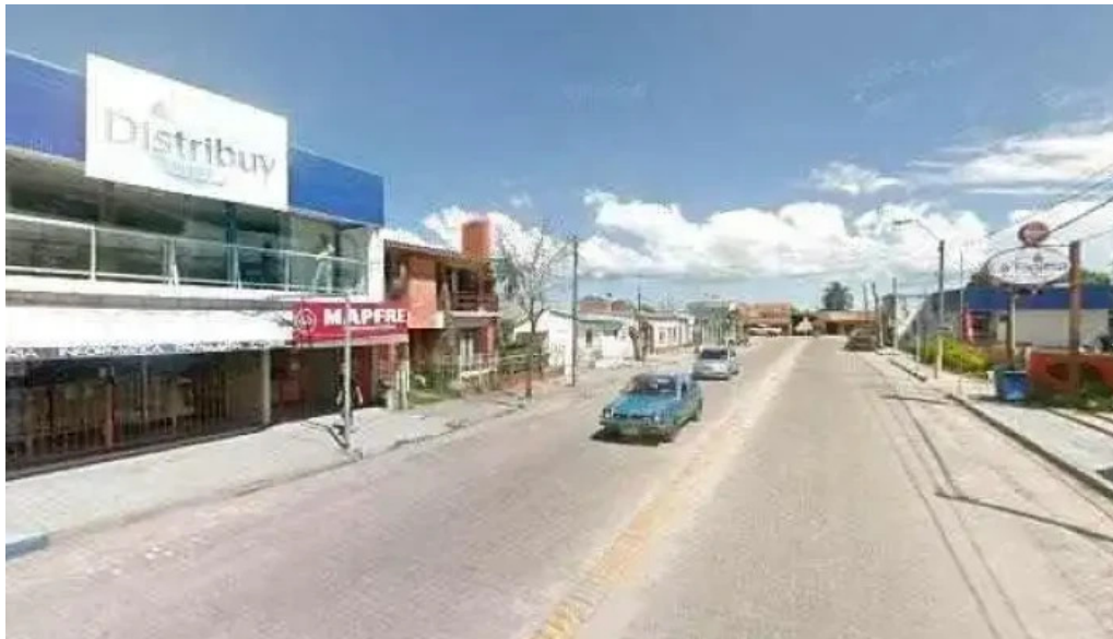
Soluciones inmobiliarias rb como llegardeg